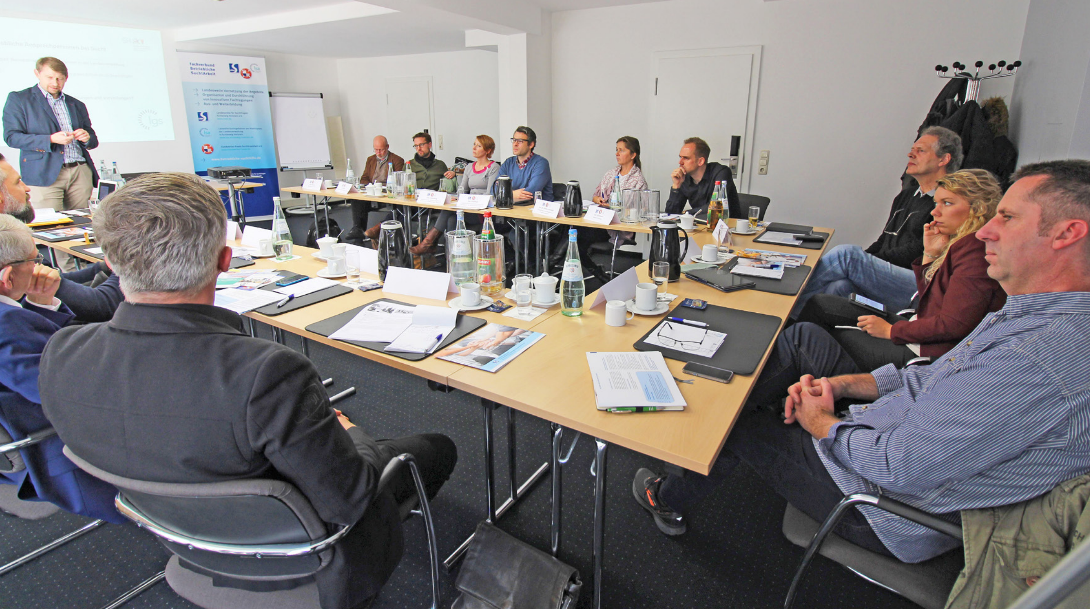
Expert*innen beleuchten die betriebliche Suchthilfe